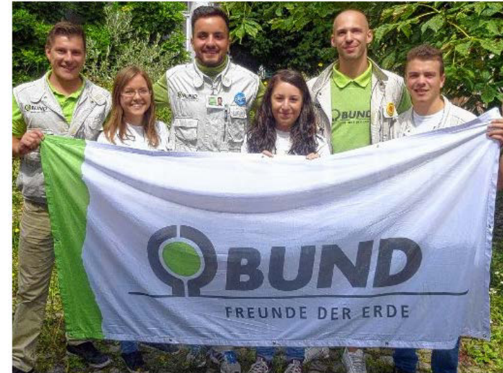
Diese „Freunde der Erde“ werben um neue BUND-Mitglieder im Kreis Lörrach.

Kreis Lörrach. Eine „Fördereroffensive“ hat der Kreisverband Lörrach des Bund für Umwelt und Naturschutz Deutschland (BUND) seit dem 1. September in Lörrach und den übrigen Kreisgemeinden gestartet. Ziel ist es, in den September-Wochen im gesamten Landkreis Lörrach neue Mitglieder und Förderer zu gewinnen. Ein Team von Studierenden aus ganz Deutschland wird zu diesem Zweck Bürgerinnen und Bürger an der Haustüre ansprechen und versuchen, diese für ein Engagement für den BUND zu gewinnen.