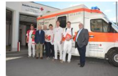
Das Rote Kreuz wirbt in Hochheim und in Massenheim um Mitglieder.

Nur aufgrund regelmäßiger Einnahmen aus den Mitgliedsbeiträgen der aktiven Helfer und der Fördermitglieder kann das DRK seine umfangreichen Aufgaben finanzieren und bewältigen, wie etwa den Dienst beim Hochheimer Weinfest oder beim 24-Stunden-Lauf des Antoniushauses vor wenigen Wochen.